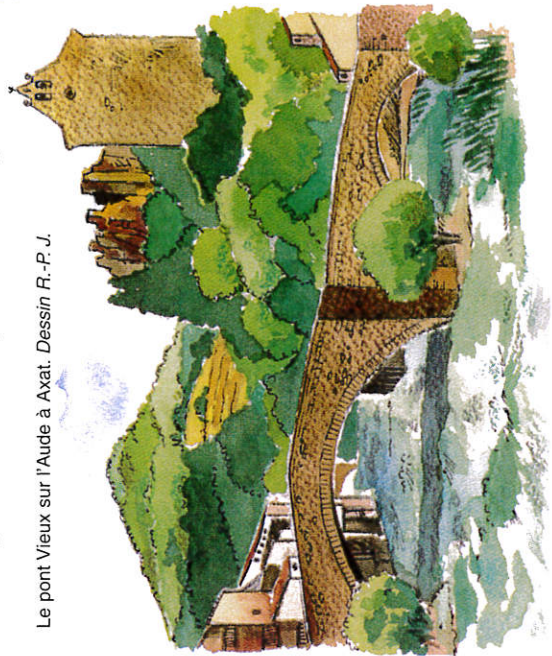
Le pont Vieux sur l'Aude à Axat. Dessin R.-P. J.